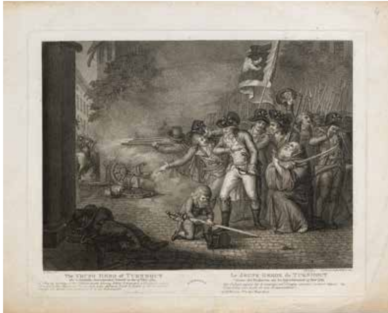
P.W. Tomkins, J.J. Van den Berghe, 'The young hero of Turnhout who so manfully distinguished himself on the 27th October 1789', 1790 Stadsarchief Turnhout

Ga op zoek naar bovenstaande prent en observeer ze. Dit werk geeft een beeld over het schoeisel dat in Turnhout werd gedragen eind 18de eeuw.