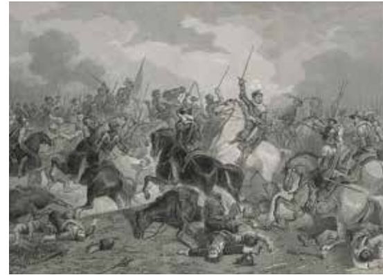
D.A. Peduzzi, J.F.C. Reclen 'Slag bij Turnhout' 19e eeuwse gravure

Loop naar de eerste verdieping, de kamer met de grote ronde tafel.