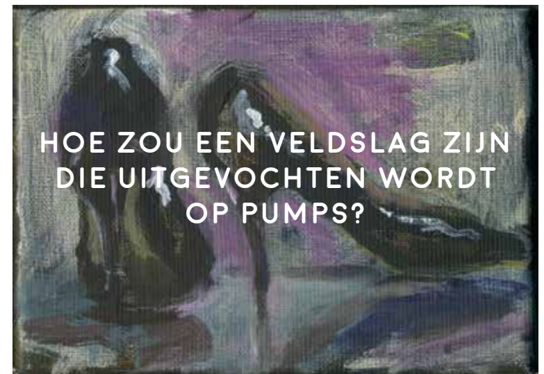
Koen Broucke, 'De pumps van Marilyn Monroe', 2017, acrylverf op doek