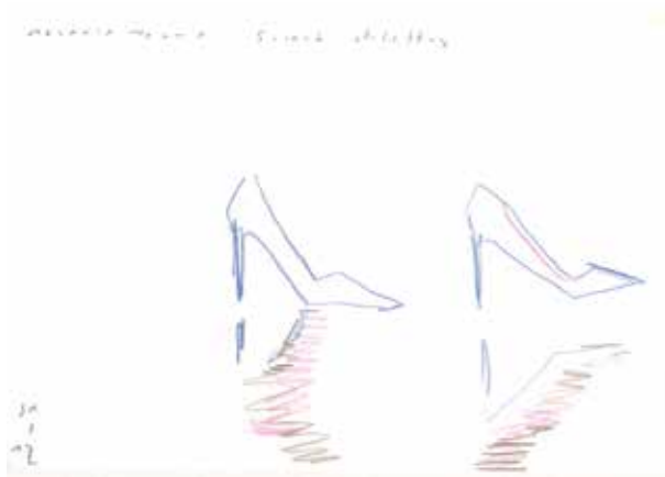
Koen Broucke, schets cat. nr. 71, 2017