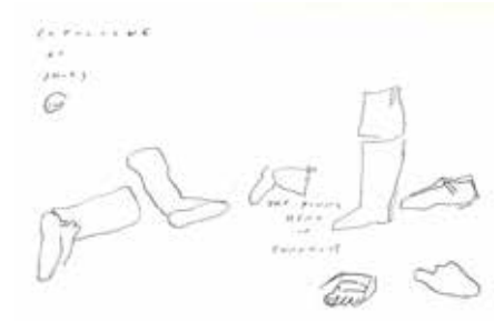
Koen Broucke, schets, cat. nr. 72

Beschrijf de verschillende soorten schoeisel die je op deze prent ziet.