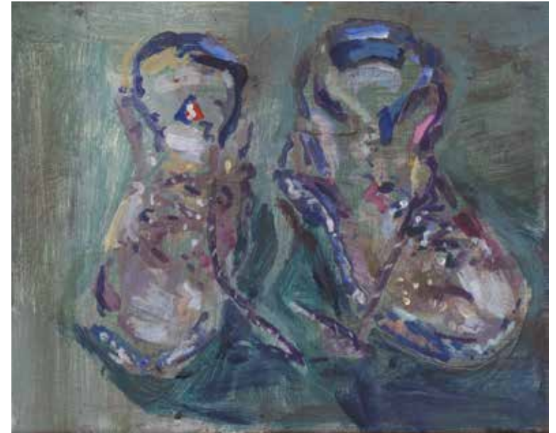
'Wandelschoenen', 2015, acrylverf op doek

Het thema 'schoenen' komt uitgebreid aan bod in de tentoonstelling: in het introductiefilmpje, in de eerste twee werken van de tentoonstelling en op de bovenste verdieping.