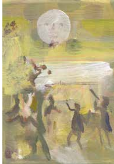
Koen Broucke, 'Het maanleger' naar een 18de eeuwse ets, 2017 acrylverf op doek