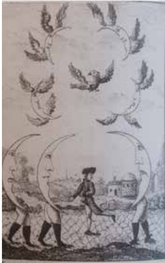
'L'accouchement de la lune' Prentenkabinet, Koninklijke Bibliotheek België