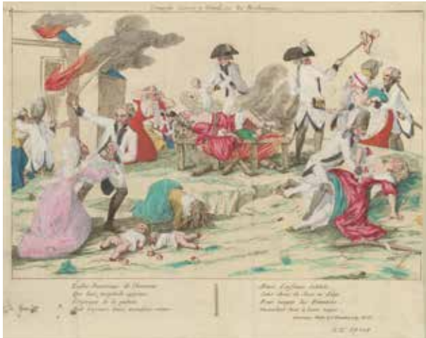
'Cruautés exercés (sic) à Gand sur les Brabçons', Histoire, révolution brabançonne, ingekleurde ets, 18de eeuw Prentenkabinet, Koninklijke Bibliotheek van België, SII 87119 alle rechten voorbehouden

Wat gebeurt er als de dader zelf zijn eigen wreedheden gaat etaleren?