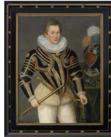
Daniël van den Queborn, 'Prins Maurits in wapenuitrusting met kanten kraag en commandostaf in zijn rechterhand, staande naast rechts een helm met verenbos', 1589, olieverf op doek, Stadhuiscollectie Arnhem