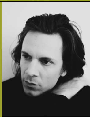
The Bony King of Nowhere