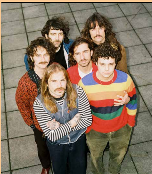
Mojo and the Kitchen Brothers