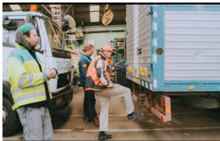
Timecircus © Tina Herbots