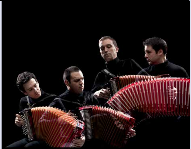
Danças Ocultas © Pedro Claudio