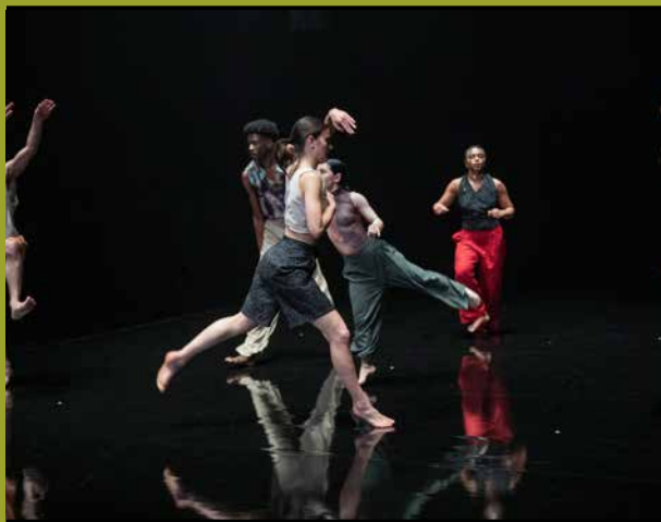
VOICE NOISE