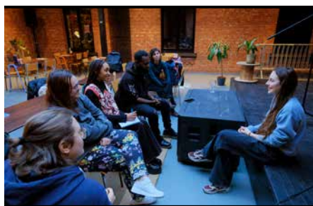
m i k s

Sidi Larbi Cherkaoui haalt met 'Sutra' Shaolin-krijgsmoenniken naar Turnhout