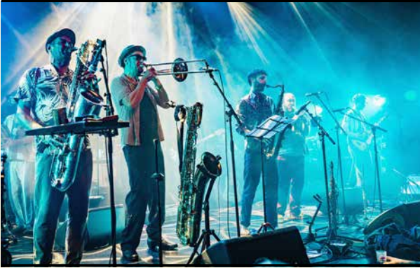
Parknacht indoor - Alpacas Collective