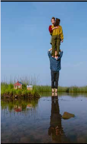
Kintsugi © Stéphane Bourgeois