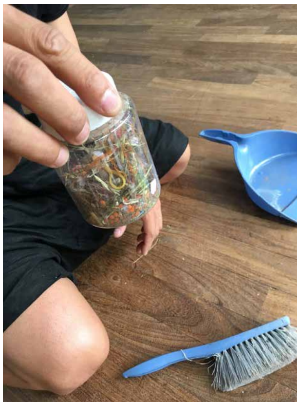
Zomeracademie 2018, Destelheide